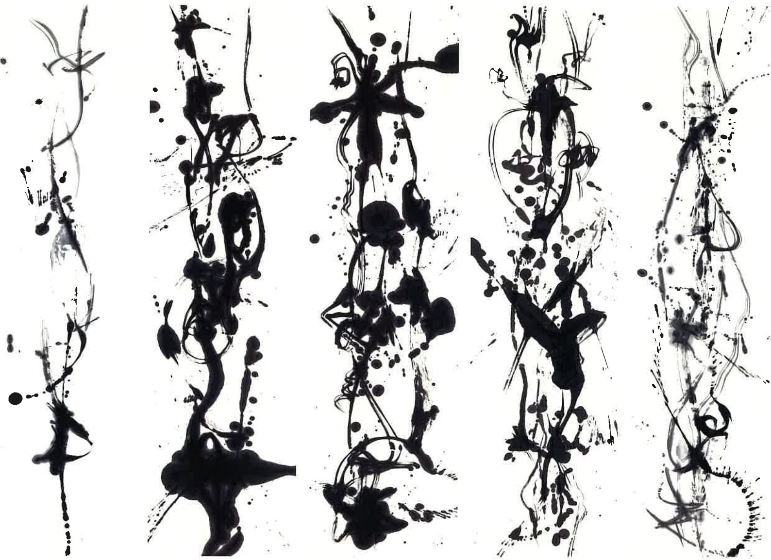
平野壮弦《樹精 -Tree Spirit- 》2021 墨、画仙紙