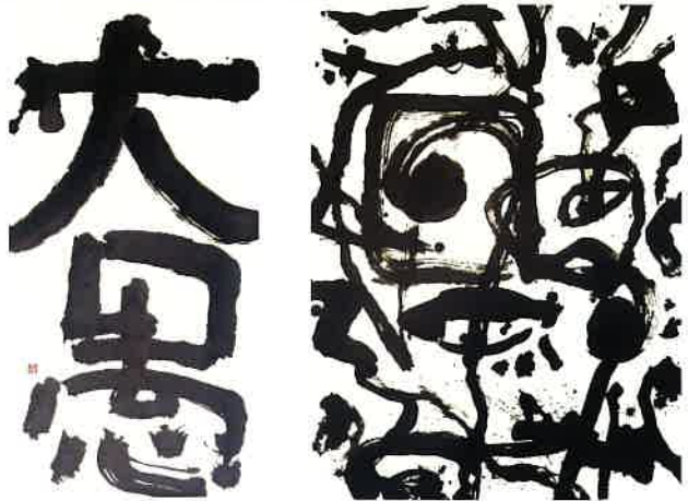
平野壮弦《大愚》1999 墨、画仙紙