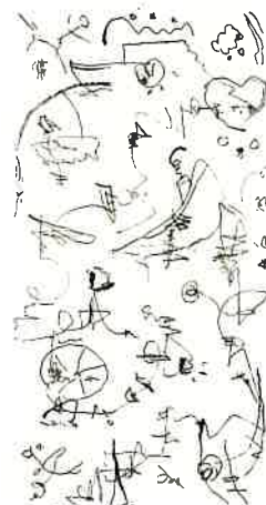
平野壮弦《無題》2012 墨、和紙

「書芸の本質は生きた線にあり、伝統に学びつつも、人マネではない、自分自身の線、カタチ、色をもって、独自の世界を表していくことを最も重視している。」(前掲書)と語り、文字にこだわることなく、生命力のある線 — 生の線 — を表す、格闘の30年の軌跡をぜひご覧ください。